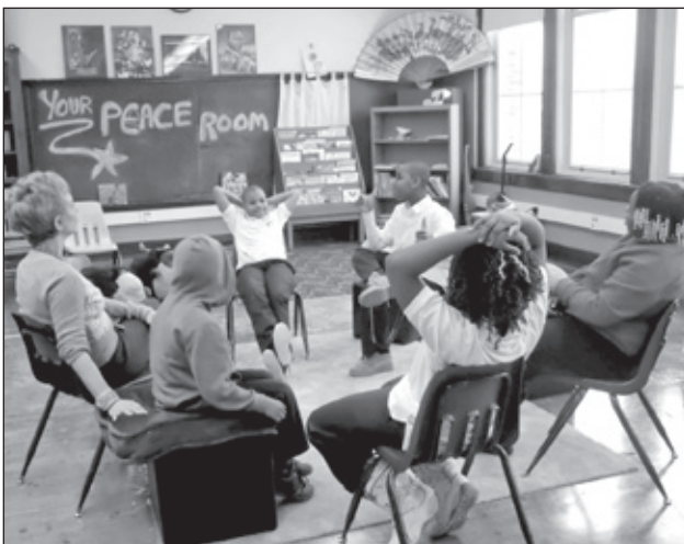
Los estudiantes pueden hablar y escuchar en el Salón de Paz de Gale Academy.

Cuando llegó el final del Círculo de Paz, los dos estuvieron de acuerdo de hablarse más respetuosamente y de pasar tiempo junto. El estudiante no fue suspendido o arrestado. En cambio, había encontrado a alguien que le escucharía y apoyaría y las dos partes involucradas habían aprendido una lección acerca de ellos mismos y de la otra persona.