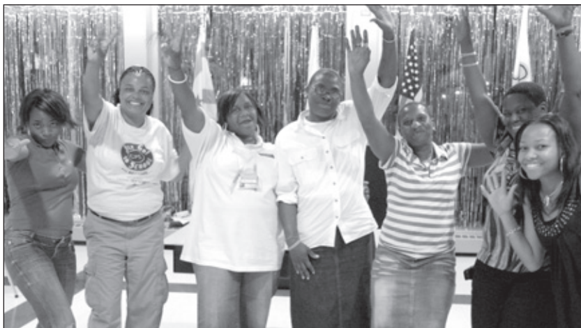
¡Celebrando el poder de los padres!

5 ¡Persista! Recuerde, para realmente cambiar la cultura de la escuela va a tomar tiempo, todos trabajando juntos y entrenando para traer los círculos, la mediación y las destrezas de resolución de conflictos a la comunidad escolar. ¡Buena suerte!