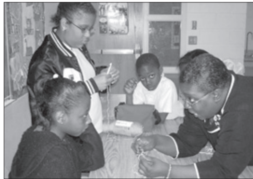
En el Centro de Paz de Austin

El programa logró más de lo que habían esperado los padres. Una evaluación por medio de una examen de reportes de calificaciones, pláticas con maestros y récords de asistencia encontró que el 80% de los estudiantes participantes mostraron mejoras académicas y los maestros reportaron cambios significantes en su comportamiento y actitud.