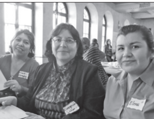
Líderes de POWER-PAC hablaron con cientos de padres en todo Chicago.