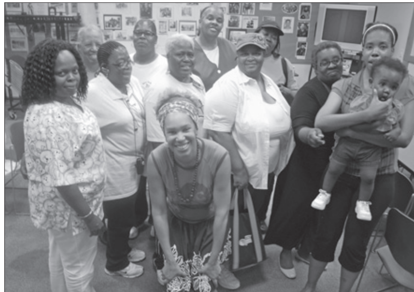
Los padres se organizan para terminar con el camino de escuela-a-prisión.