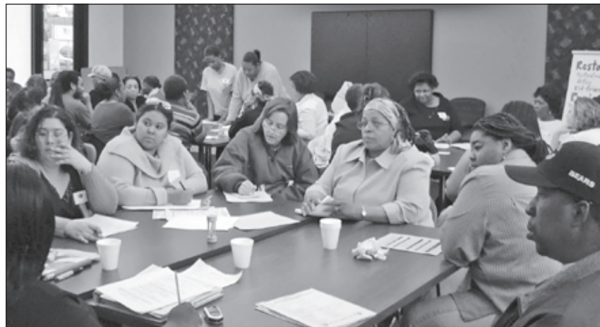
Foro comunitario en el lado sur

—Tema de portada de Catalyst Chicago , junio 2009